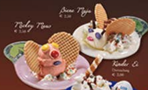
Kinder Ei Dessert € 2,50