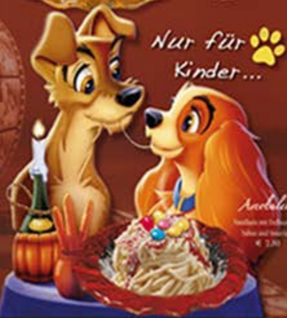
Amorbline Sahne mit Erdbeeren, Sahne und Schokolade € 2,80